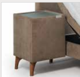
Focus nachtkast 40x40x45cm