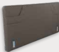
Organizer H92/112 - D7cm