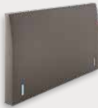
Flexion H92/110 - D15cm