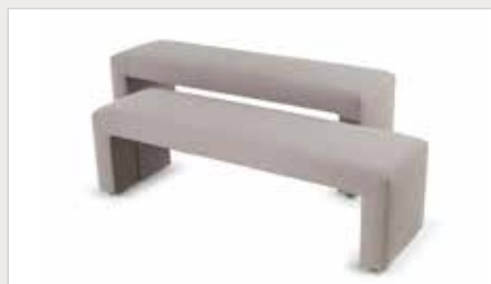
Bank Reposa/ Reposa XL L140 x B41 x H41cm/ L140 x B41 x H50cm