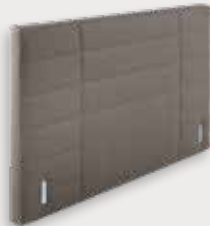
Smart H112 - D11cm