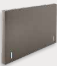
Recto H92/110 - D12cm