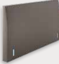
Mania H110/92 - D15cm