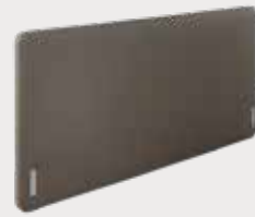
Slender H92/110/112 - D72cm