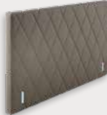
Diamond H112 - D11cm