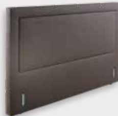
Mirage H123 - D12cm