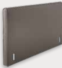
Arch H97/115 - D12cm