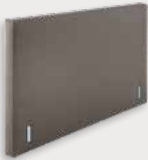
Square H92/110 - D12cm